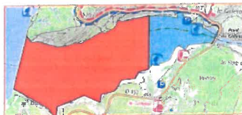
5/ Anse de Galetas (Alguines/Moustiers) Depuis les matts en amont jusqu'au cap du hameau du Pont et anse St Saturnin en aval. 60 ha