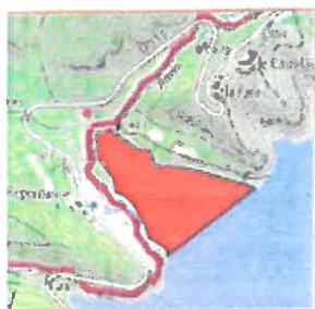
4/ Anse de Repentance (Ste-Croix du Verdon) Le fond de anse jusqu'au cap matérialisé par des panneaux. 12 ha