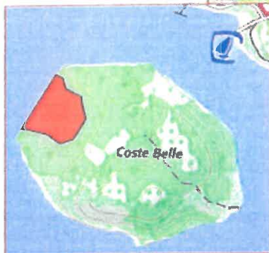
2/ Anse de Coste Belle (Salles/Verdon) Les 2 fonds de anse entre la cale de mise à l'eau (677m NGF) et le cap sur la piste de Garuby + la dent creusée de l'île matérialisée par des panneaux. 76 ha