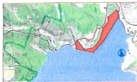
3/ Anse de Font Collomb (Moustiers/Ste-Marie) En zone littorale du plan d'eau, depuis la confluence avec la Plaine en rive droite en amont, jusqu'à la limite de la forêt domaniale en aval. 10 ha