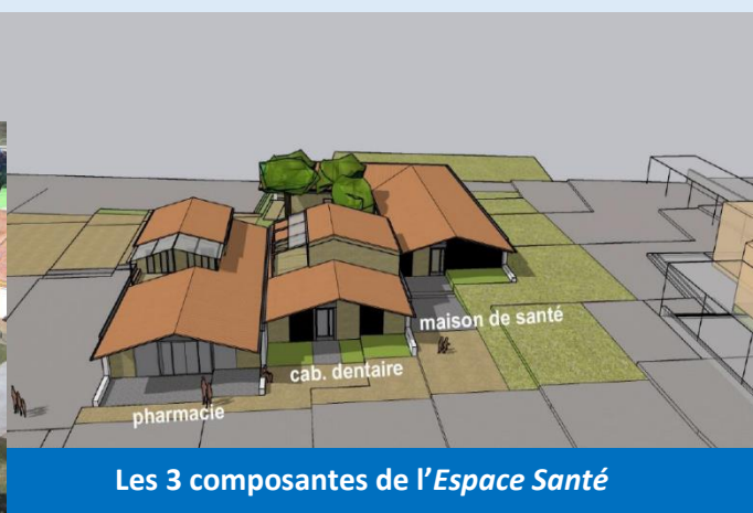
Les 3 composantes de l'Espace Santé