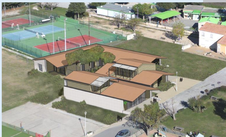
Vue aérienne du futur Espace Santé du hameau St Pierre