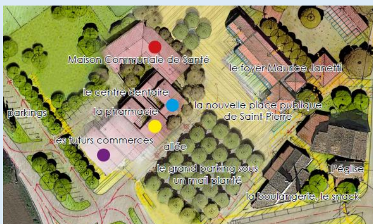
Représentation aérienne de l'Espace Santé, des parkings et des espaces piétons

Le territoire communal qui se caractérise à la fois par son étendue très vaste (76 km 2 ) mais aussi par la dispersion de son habitat, puisque notre population est répartie sur 28 hameaux différents, rend indispensable les déplacements en voiture , et donc de disposer de parkings adaptés pour tous .