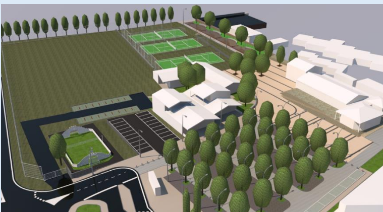
Autre présentation aérienne avec au premier plan le futur grand parking central arboré

Avec presque 60 places sur le parking central (entre l'Espace Santé et la salle Janetti), et plus de 40 places supplémentaires sur le deuxième parking (qui sera situé à quelques dizaines de mètres, au sud de la future pharmacie), les accès seront parfaitement fluides pour les véhicules.