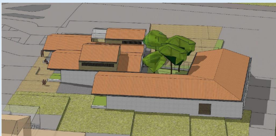
Les bâtiments de l'Espace Santé avec au premier plan, la façade nord de la Maison Communale de Santé